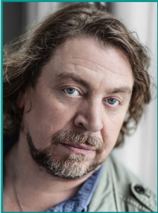
Schirmherrschaft: Armin Rohde

Chance e.V. Rincklakeweg 19 48153 Münster Tel.: 02 51- 13 46 63 72 Mobil: 01 62 - 4 29 17 20 Fax: 02 51- 28 73 52 10 h.clephas@chance-muenster.de www.chance-muenster.de