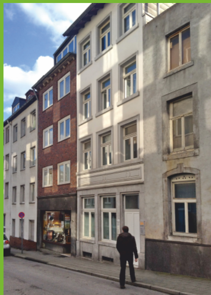
Beratungsstelle Königstr. 1b • 52064 Aachen