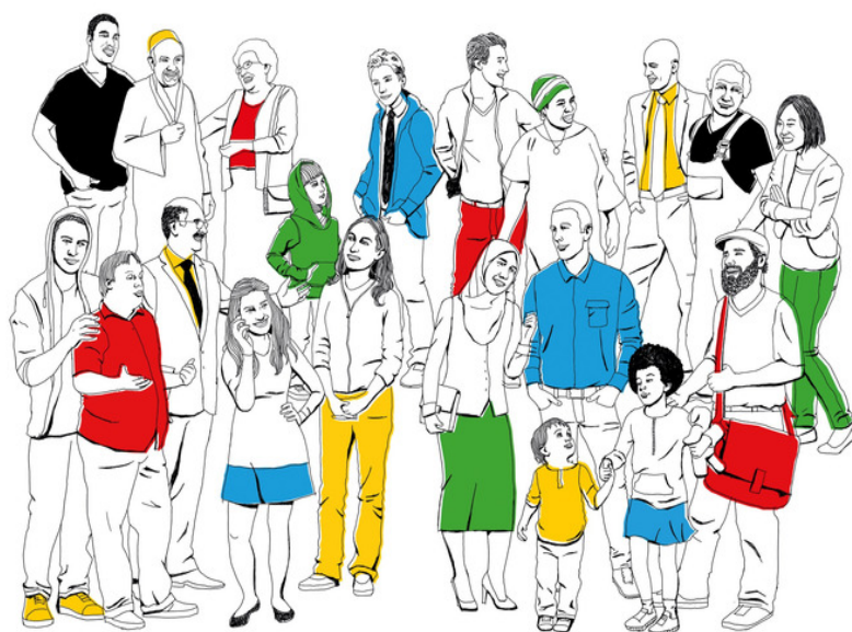
Abbildung: Regiestelle "Demokratie leben!" / Andreas Schickert