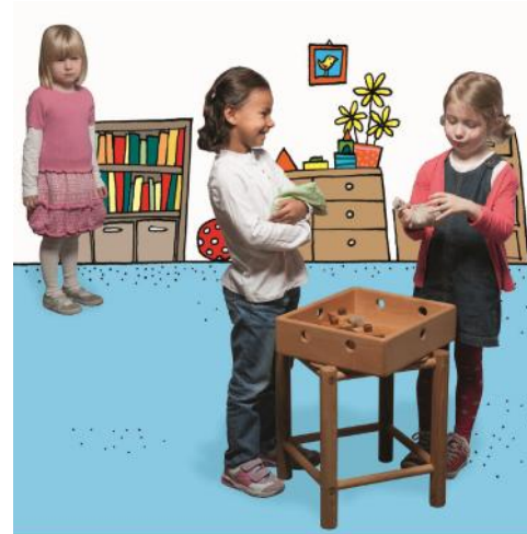
Mitspielen | Deutsche Liga für das Kind 2013