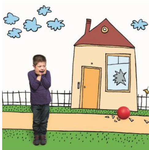
Die Scheibe ist kaputt | Deutsche Liga für das Kind 2013

Schwierige Situationen: Welche Lösung kann es geben?