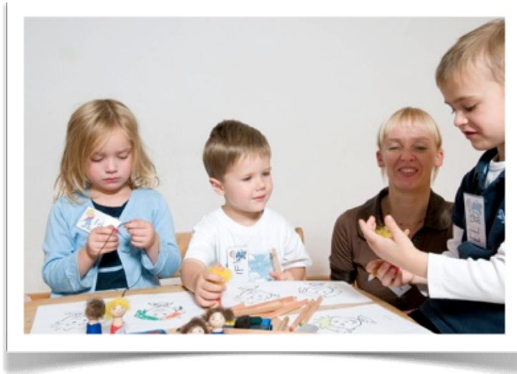
Szenen mit den Fingerpuppen nachspielen...