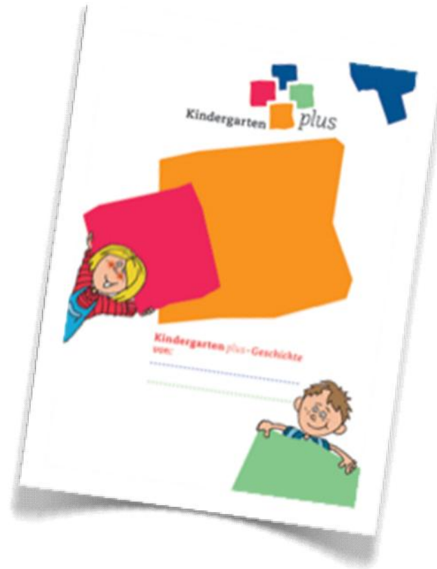
Lerngeschichte Kindergarten plus